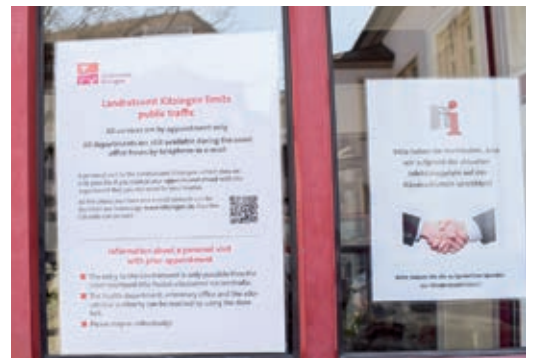
Unter anderem auf Englisch wurden die Bürger über die Einschränkungen informiert.