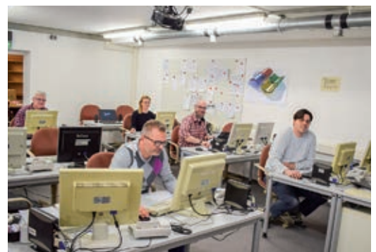
Im Katastrophenschutzkeller leistete die Führungsgruppe Katastrophenschutz Dienst.