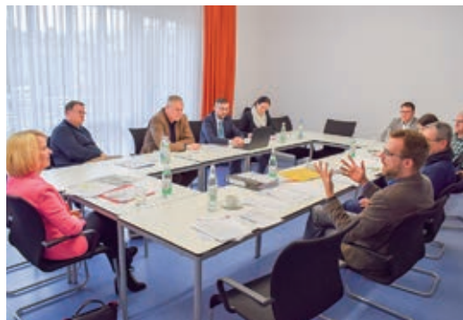
Treffen des Corona-Krisenstabs Anfang März unter der Leitung von Landrätin Tamara Bischof.