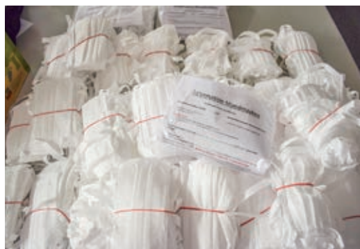
Unzählige Community-Masken wurden von fleißigen Ehrenamtlichen genäht. DANKE!