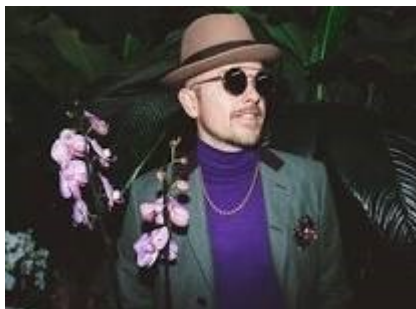
Jan Delay am 10. Juni 2023